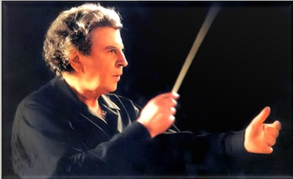
Συνθέτης Μίκης Θεοδωράκης Ελλάδα 1925