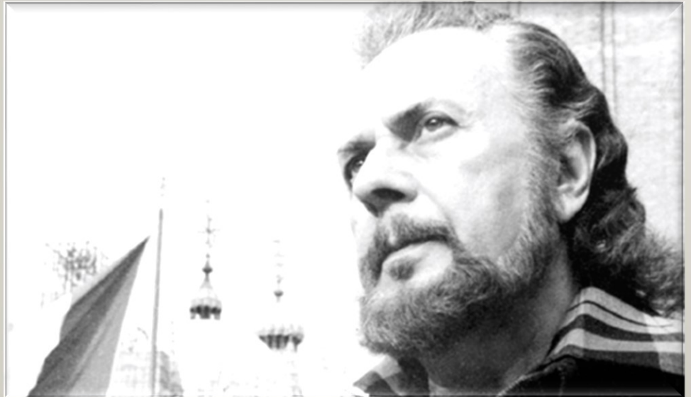
Στιχουργός Γιάννης Ρίτσος Ελλάδα 1909-1990