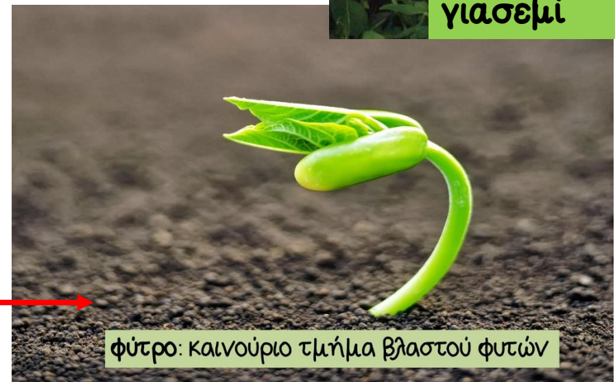
φύτρο: καινούριο τμήμα βλαστού φυτών