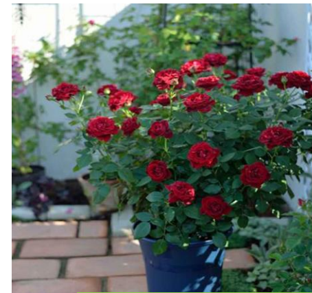
Ρόδα: τα τριαντάφυλλα