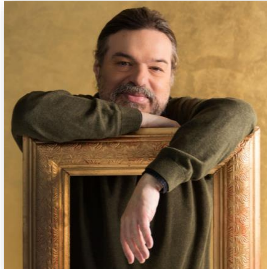
Συνθέτης: Δημήτρης Παπαδημητρίου (1946)