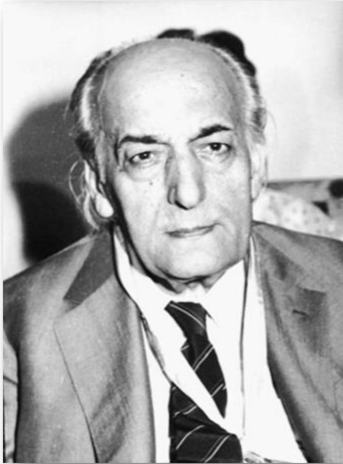
Στιχουργός: Νίκος Γκάτσος (1911-1992)