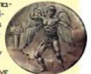
Ο γίγαντας Τάλως από το βιβλίο του Νηλ Φίλιπ Μύθοι απ' όλο τον κόσμο, εκδ. Ερευνητής